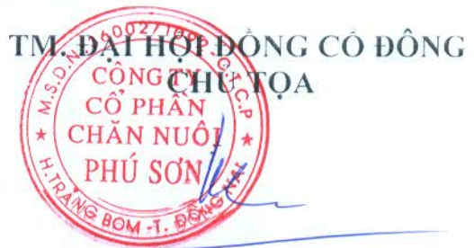
Phùng Khôi Phục